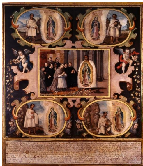
Historia de la aparición de la Virgen de Guadalupe , de Juan de Correa (Méjico, 1646[ca] - Méjico, 1716) en 1667. La leyenda incluida en la parte inferior explica las cinco partes del cuadro (de izquierda a derecha y de arriba abajo, la central es la 5ª).