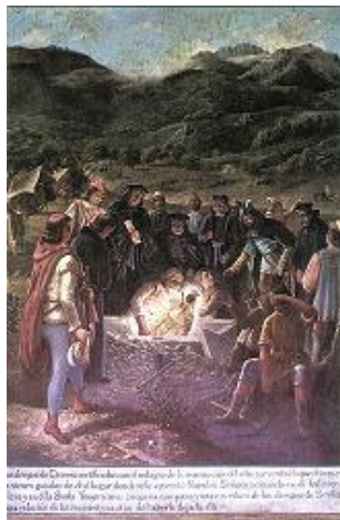
Escenificaciones de la aparición mariana y del milagroso hallazgo de la talla atribuida a San Lucas