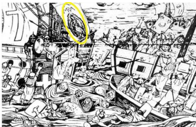
Grabado, de fecha no precisada, que muestra la galera de Andrea Doria en la Batalla de Lepanto (1571) y donde se advierte el estandarte de la Virgen de Guadalupe de Méjico

En seguida se difundieron por todas aquellas `Indias´ las noticias de los milagros y saltaron el océano. Un claro ejemplo de ello es que, a 40 años de las apariciones, la devoción Guadalupana ya era conocida y estimada en Europa: el 7 de octubre de 1571, en la Batalla de Lepanto, “la más alta ocasión que vieron los siglos”, el estandarte de la galera capitana de Giovanni Andrea Doria, el almirante genovés al servicio de España que mandaba el ala derecha de la flota cristiana, llevaba una imagen de la Virgen de Guadalupe mejicana; lo había regalado Felipe II. El lienzo se conserva hoy en la iglesia de La Madonna di Guadalupe en Santo Stefano d’Aveto ( Italia) x .