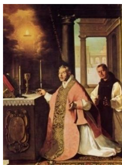
La “Misa milagrosa el Padre Cabañuelas” (fray Pedro de Valladolid), pintado por Zurbarán en 1638 y conservado en el Monasterio de Guadalupe.

Siguiendo las instrucciones de la Virgen, la primera edificación fue una choza o eremitorio, levantándose más tarde otra pequeña de piedra, a la vez que iba creciendo la fama del lugar por la devoción que suscitaba y los milagros que allí se producían. En este contexto, Alfonso XI lo visitó hacia 1330 y al encontrar la iglesia medio derruida, mandó alzarla y ampliarla. También acudió antes y después de la Batalla del Salado (30 de octubre de 1340), en súplica de intercesión y agradecimiento a la Virgen. En 1389 llegaron al ya monasterio 31 monjes de la Orden de San Jerónimo, permaneciendo allí hasta la perversa desamortización de 1835. En 1420 tuvo lugar el milagro eucarístico de la “Misa milagrosa del Padre Cabañuelas”, que inmortalizara Zurbarán.