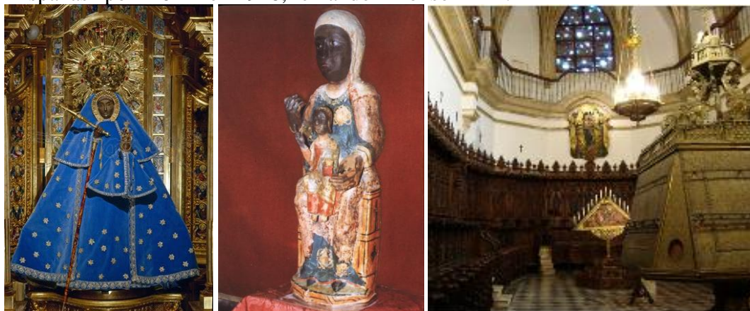
La Virgen de Guadalupe, con y sin manto, en el altar mayor del monasterio. Enfrente, en el coro, la imagen de la Inmaculada de la que luego se hablará.

La Santísima Virgen, bajo la advocación de Guadalupe , es patrona de ese pueblo cacereño desde 1907 y de Extremadura por extensión. Su fiesta se celebra el 8 de septiembre. “La Morenita”, como también se la conoce, fue coronada canónicamente como “Reina de la Hispanidad” - Hispaniarum Regina - o de “las Españas” por Pío XI en 1928, reinando Alfonso XIII i .